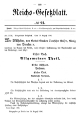
Verkündung des Bürgerlichen Gesetzbuchs (1896)