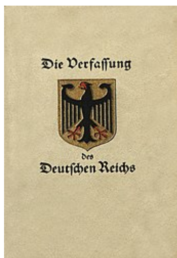
Bucheinband der Verfassung der Weimarer Republik von 1919

Weimarer Republik-Verfassung ist keine Reichsverfassung, sie ist auch keine demokratische Verfassung, da diese durch einen Putsch, Verfassungshochverrat, Wahlbetrug, ein Nichtverfassungsorgan und dem Hochverrat am Deutschen Volk, am Bundespräsidium, am Bundesrath, am Reichstag und an der verfassungskonformen Reichsleitung, oktroyiert wurde.