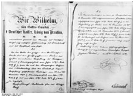
Erste und letzte Seite der Verfassungsurkunde von 1871 Bismarcksche Reichsverfassung

Nach dem Deutschen Krieg zwischen Österreich und Preußen 1866 gründete Preußen zusammen mit den anderen norddeutschen Staaten den ersten deutschen Staatenbund. Dieser Norddeutsche Bund erhielt eine Verfassung, die am 1. Juli 1867 in Kraft trat. Vereinbart hatte sie das Bündnis der beteiligten Fürsten einerseits und ein konstituierender Reichstag, der im Februar 1867 eigens für die Vereinbarung gewählt worden war. Die Verfassung des Norddeutschen Bundes oder Norddeutsche Bundesverfassung vom 16. April 1867 wurde maßgeblich im preussischen Staatsministerium unter Otto von Bismarck , dem preussischen Ministerpräsidenten, entworfen. Die Verfassung sah einen Bundesrath als Vertretung der Fürsten und einen vom Volk gewählten Reichstag vor, die gemeinsam Gesetze beschlossen. Ziel war es, jeden bundesstaatlichen Zentralismus unter ein Dach "Deutsches Reich" im Sinne des ewigen Bundes zu vereinen, der hohe Preis für Preußen war die bestehende preussische Hegemonie aufzugeben. Das Bundespräsidiums steht dem König von Preußen zu und nur er ernannte den Bundes- bzw. Reichskanzler des Deutschen Reiches, des ewigen Bundes und des Nationalstaat Deutschlands.